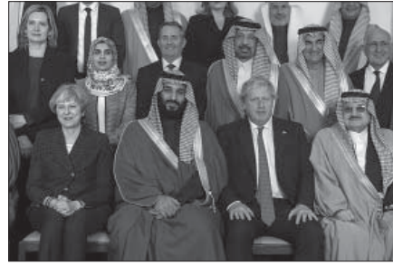
لقطة للتاريخ، مع ملك المستقبل!

لمحرر شؤون الشرق الاوسط إيان بلاك، اعتبر فيه المملكة السعودية تاريخياً أكبر سوق لتصدير الأسلحة البريطانية. ويضيف ان البلدين يتشاركان في نحو ٢٠٠ مشروع اقتصادي، تصل قيمتها الإجمالية إلى نحو ١٧,٥ مليار دولار، كما ان هناك ما يزيد على ٢٠ ألف بريطاني يعيشون ويعملون في السعودية.