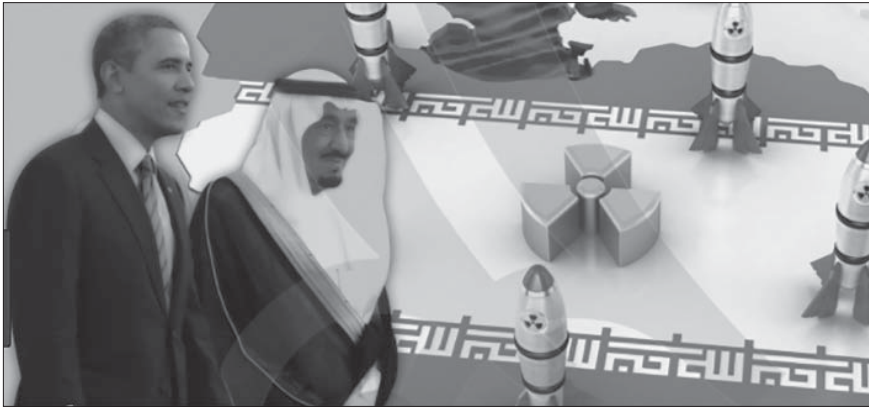
عقدة سعودية من إيران.. وحلم بالنووي!

الظروف الآن تبدلت، وأصبح بإمكان محمد بن سلمان وإدارة ترامب أن يستأنفا النقاش النووي، بعد أن أوصلت الرياض رسالة إلى واشنطن بأنها قد تلجأ إلى الروس أو الصينيين لتحقيق الحلم النووي السعودي.