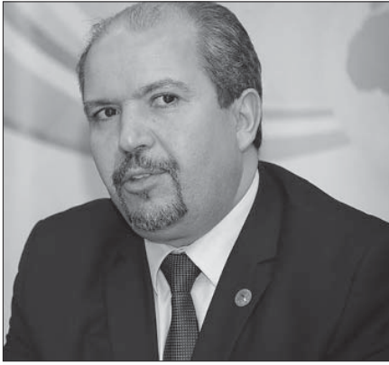
وزير الشؤون الدينية الجزائري للوهابيين: الولاء للنظام وعدم الخروج عليه!

ومع ذلك، إذا كان التيار المدخلي «غير سياسي» في جوهره، ومعادي لأي فكرة تدعو إلى الخروج على السلطة، وأيضاً ضد أي دعوة للجهاد ضد المسلمين وأتباعهم، باسم فكرة متشددة وصارمة من الإسلام، غالباً ما يتم الخلط بينه وبين السلفيين الأكثر تطرفاً. حدث هذا، على سبيل المثال، في ليبيا، قبل أسابيع قليلة، عندما قام أتباع التيار المدخلي بتسوية قبر والد ملك ليبيا السابق، محمد إدريس السنوسي، مؤسس الطريقة السنوسية، التي نشأت في مدينة