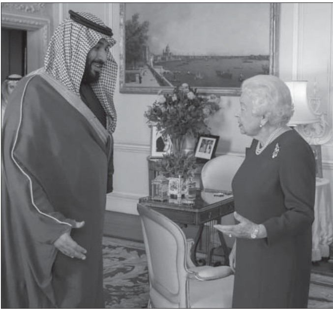
من لا يحترم شعبه لا يستحق الإحترام

صفقات تجارية او استثمارات او ما أشبهه. ولأن الولد سر أبويه، بل سر عائلته، كان محمد بن سلمان في زيارته الأخيرة لمصر، ولندن، وسيكون كذلك في زيارته لواشنطن، الشاب النزق الذي ينثر الأموال ولا يُبالي، وكل ما يحصل عليه: شيء من الترحيب من مضيفيه، مختلط بالإحتقار.