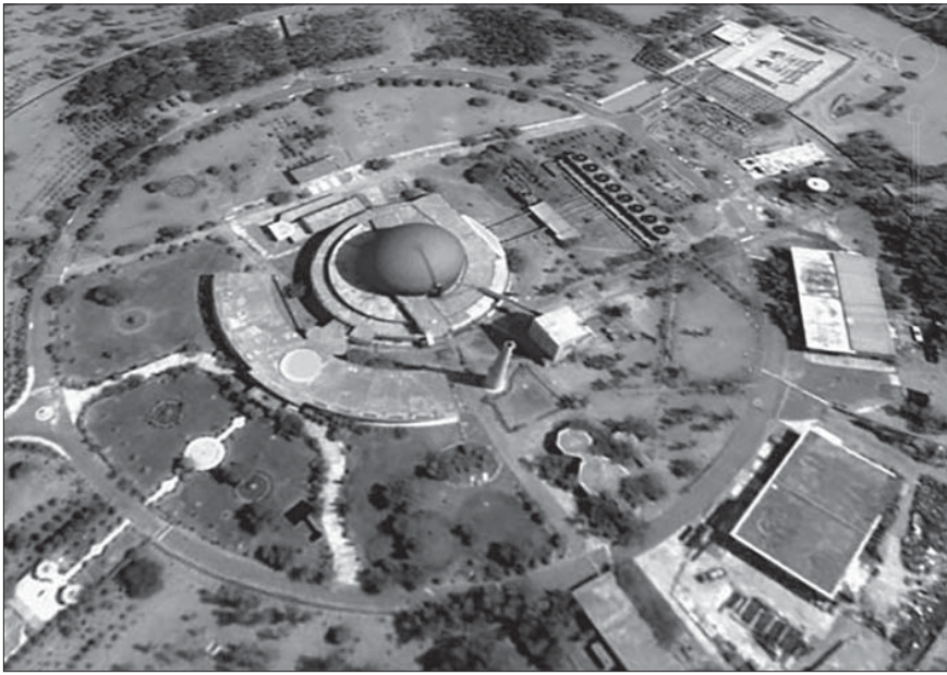
المفاعل النووي الباكستاني خوشاب: هل تستفيد السعودية منه؟

ورجح ليبمان ان الرياض لن تسعى إلى حيازة أسلحة نووية، بغض النظر عن مآل البرنامج النووي الإيراني، لأن المضاعفات السلبية لهكذا مسعى ستفوق بشكل كبير أي مكسب استراتيجي قد يرسخ عنه. فالمملكة، التي تعتبر ضمن الدول الموقعة على معاهدة الحد من انتشار الأسلحة النووية، وقد ربطت مستقبلها بالاندماج الكامل في النظام الاقتصادي والصناعي العالمي، وبالتالي فهي غير قادرة على تحمّل الإقصاء الدولي الذي قد