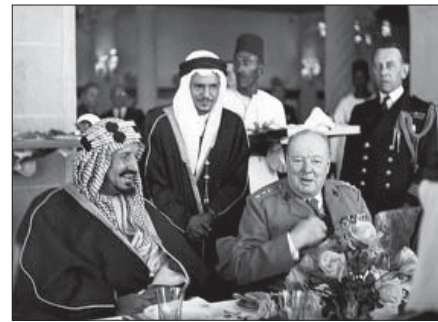
استثمار العلاقات التاريخية - تشرشل وابن سعود في المياه المصرية

حتى ان كبارهم راحوا يرددون ما يكتبه المغردون على تويتر وفايسبوك، في اطار العموميات التي تصلح لهذه الزيارة، والزيارة المقبلة بعد عشرة اعوام، بينما انهمك آخرون في حملة الرد على المعارضين والصحف ومواقع القنوات الرئيسية مثل بي بي سي، للدفاع عن اميرهم ومملكتهم. فلماذا فشل الهجوم الذي اراده الامير الشاب فتحا لانجازات تاريخية، بعد ان اوعز الى موظفيه بأن يكثرُوا من تشبيهه بجده عبد العزيز؟ وحثهم على المقارنة بين هذه الزيارة واللقاء التاريخي الذي اجراه الملك المؤسس مع رئيس الوزراء البريطاني ونستون تشرشل والذي جمعهما في السابع عشر من شهر فبراير ١٩٤٥؟ وكما كان محمد بن سلمان يحلم أن يعيد أحد الكتاب البريطانيين القول عنه انه: «رجل وسيم ورائع.. وله وجه صادق جدا ولا يخفي سرا.. ويشتهر بأنه نبيل وسخي، ولا ينحدر إلى مستوى الأعمال الدنيئة».. وهي الكلمات التي وصف بها الكابتن ويليام شكسبير، الممثل السياسي البريطاني في الكويت، مؤسس الدولة السعودية الثالثة الملك عبدالعزيز آل سعود.