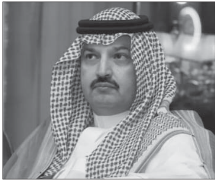
الأمير تركي بن طلال، نائب أمير عسير: هل يقنع طلال وابنه الوليد بهذه الحصة من الحكم؟

في منصبه في ٢٣ أبريل ٢٠١٧، محل الفريق ركن عيد بن عواض الشلوي ضمن سلسلة أوامر ملكية شملت قطاعات متعددة ومن بينها إمارات المناطق والديوان الملكي والخارجية ومجلس الوزراء. وبحسب الأوامر الملكية الجديد فقد تمّ