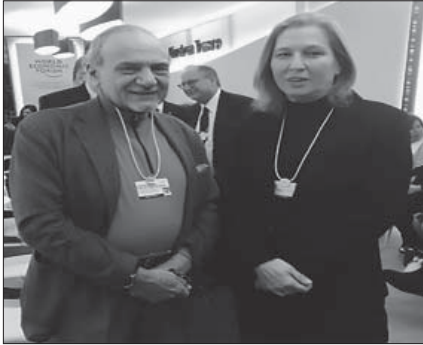
تركي الفيصل مع تسيبي ليفني

إيرانية، وعلق: (لا بأس.. العبوا بعقولنا، وأعدوا لنا ولو مرة واحدة مع حبايبكم الصهاينة، مسرحية تكونون أنتم أبطالها). وتابع: (قولوا ما شئتم عن محور الممانعة، لكن الحقائق على الأرض تقول ان جميع الخسائر التي تكبدها الكيان الصهيوني خلال العقود الثلاثة الماضية، كانت بفعل ضربات هذا المحور الذي تحاربه أمريكا وعملائها في الخليج). ايضاً وفي سياق التطبيع مع الصهاينة، وكما