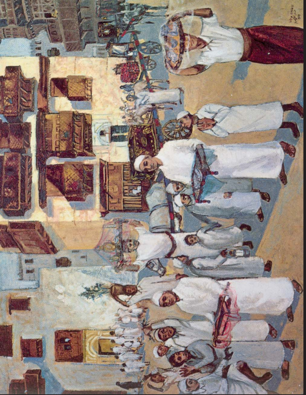
لوحة للفنانة صفية بن زقر