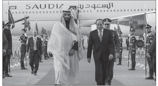
احتفاء بالدب الداشر.. ليس حباً فيه، وإنما من أجل المال!