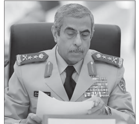
إقالة رئيس هيئة الأركان عبدالرحمن البنيان: إنها لعنة اليمن!

لا يمكن فصل سلسلة الأوامر الملكية المتعاقبة عن خطة إعادة تشكيل السلطة، تنتهي في نهاية المطاف بتتويج محمد بن سلمان ملكاً. في حقيقة الأمر، أن كل دفعة من الأوامر الملكية لا تشتمل على أمر التتويج يعني أن شروط التأهيل للوصول الى مرحلة التتويج لم تكتمل بعد، ولذلك يتم استحداث أو بالأحرى تحديث خطة التتويج. هناك غضب وسط العديد من أجنحة العائلة المالكة يراد ترقيتها، وهناك فشل في أكثر من ملف إقليمي يراد الالتفاف عليه أو استيعاب آثاره ونتائج قبل أن يصعب السيطرة عليه، وهناك سخط شعبي إزاء الرسوم المرتفعة على الكهرباء، والضريبة المضافة على المشتريات، ورفع الدعم عن المشتقات البترولية يراد تهدئته عبر تقديرات اجتماعية خادعة.