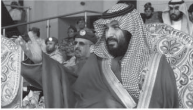
Crown Prince Mohammed bin Salman will meet Theresa May and British royals

Saudi Arabia's crown prince replaced a number of senior generals and in a rare move, named a woman to a government position, heralding a potential shift in the kingdom's role in the Yemen war on the eve of his first official visit to Britain.