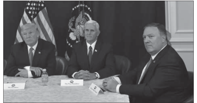
صقور الحرب، ويظهر المتطرف بومبايو وزير الخارجية الجديد، شديد العنصرية ضد المسلمين

■ في جانب ثالث، فإن القوة الإيرانية المتنامية، أظهرت أنها وحلفاءها يمثلون القوة الوحيدة المضادة للمشروع الأميركي الإسرائيلي السعودي في المنطقة. وقد تغذّت على أخطاء الحلف الأمريكي، وأخطاء السياسة الخارجية السعودية، فأضعفت النفوذ السعودي بشكل غير مسبوق تاريخياً، ولا زالت الانتكاسات السعودية تترى الى الآن. وهذا يدلنا على سر العداء المستوطن في ذهن القيادة السعودية لكل ما له صلة بإيران. وحتى بالنسبة للكيان الصهيوني، فلأول مرة يأمن كل الأنظمة العربية، التي تم تحييدها باتفاقات كما جيرانه (عدا لبنان وسوريا)، او عبر انخفاض منسوب الاهتمام بالقضية الفلسطينية، واستبدال النظام الخليجي الرسمي (العدو الإيراني، بدلاً من العدو الصهيوني!