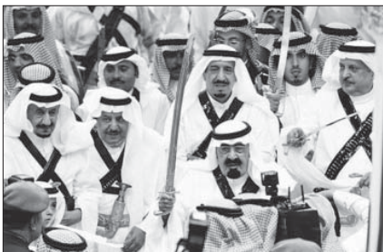
العائلة المالكة.. عشرات الألوف من الأمراء يفتنزون على السلطة

ومؤسسات القطاع الخاص. أحد أفراد المجموعة التي شاركت في الاحتجاج، فصل مباشرة من موقعه في الاتحاد الرياضي السعودي، ومن المحتمل أن يقدم شخص آخر من نفس المجموعة إلى المحاكمة بتهمة الخيانة.