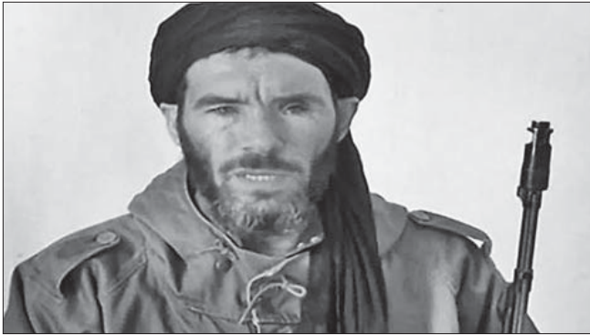
المختار بلمختار زعيم القاعدة في المغرب العربي

وتشكل منطقة الساحل والصحراء، إحدى الساحات المرشحة لعمل مقاتلي تنظيم «داعش» القادمين من سوريا والعراق، بالإضافة إلى ليبيا والصومال وجنوب شرق آسيا وأفغانستان، وإن استهداف القوات الفرنسية والأمريكية تنطوي على رسالة واضحة بأن مقاتلي التنظيم قد وصلوا إلى منطقة الساحل والصحراء، وأنه بات قوة مسلحة ومصدر تهديد جنباً إلى جنب تنظيم القاعدة في بلاد المغرب الإسلامي، والذي ينظر إليه على أنه أكبر وأخطر جماعة مسلحة في منطقة الساحل والصحراء وشمال أفريقيا. في المقابل، فإن رسائل البغدادي إلى مساعديه الليبيين تنطوي على خيبة أمل كبيرة نتيجة الهزائم التي لحقت بالتنظيم في العراق والشام ولاحقاً في مدينة سرت الليبية. دعوة البغدادي لمساعديه بالتوجه إلى الجنوب، والاستعانة بالتضاريس الوعرة على استقبال المقاتلين الهاربين من العراق وسوريا، والإفادة من ثروة ليبيا النفطية وجواره الأوروبي تحمل في طياتها ركائز في استراتيجية «داعش» الأفريقية.