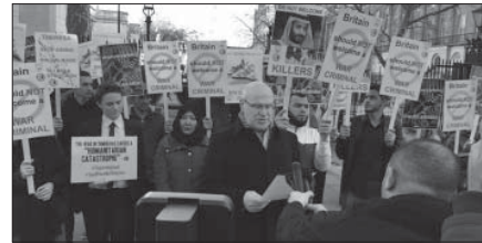
مناهضة الحرب يتظاهرون: ابن سلمان قاتل!

بدوره، دعا عضو حزب العمال البريطاني كريس وليامسون، إلى سياسة خارجية أخلاقية، معتبراً أن ما يجري في اليمن منذ عام ٢٠١٥، كفيل بأن