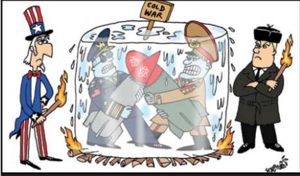
السعودية والحرب الأمريكية الباردة