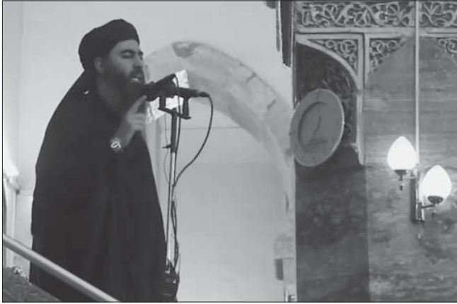
البغدادي لأنصاره الليبيين: ضرب الأعناق للمرجفين بينكم!

وتعطيل مؤقتاً على الأقل قدرته على المدى الطويل على إجراء ودعم العمليات الإقليمية في شمال أفريقيا ومنطقة الساحل وأوروبا. ويستدرك تقرير الخارجية بالقول: على الرغم من أنه تم اجتثاث ما يصل إلى ١٧٠٠ من مقاتلي داعش في سرت، فثمة اعتقاد بأن العديد من أعضاء التنظيم قد هربوا إلى الصحراء الشاسعة في غرب ليبيا وجنوبها، في حين أن آخرين قد هربوا إلى الخارج أو إلى المراكز الحضرية المجاورة. كما تم الإبلاغ عن تجمعات لمقاتلي داعش في درنة وبنغازي خلال العام. وقد تم التخلص من العديد من المقاتلين في تلك المدن بحلول نهاية العام، وقد هرب مقاتلو داعش الفارين من سرت إلى معسكرات صحراوية نائية، وخاصة بالقرب من سبها وبني وليد، لكن بعض التقارير أشارت إلى أن آخرين هربوا إلى درنة وغيرها من المراكز الحضرية في ليبيا. وقد احتفظت منظمات أخرى بوجوداتها المتماسكة، من بينها جماعة