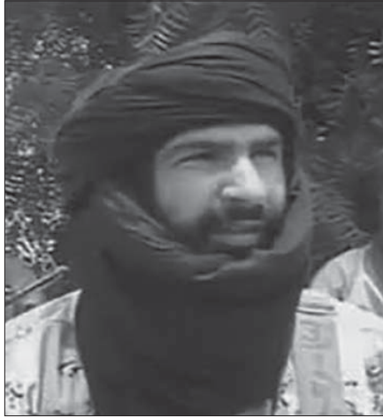
عدنان أبو الوليد الصحراوي - زعيم داعش في المغرب العربي

«وقد يظن بعض المغرضين أو العوام في الشرق أو الغرب بأن الآية الشريفة تدل على أن الله تعالى يأمر النبي بالكرهية والعنصرية تجاه الآخرين، وبث النفوس والقتال في النفوس دون وجه حق. وهذا الوهم ليس له أدنى نصيب من الحقيقة. وهو استنتاج مغلوط لأنه مبني على فرضية مغلوطة تغفل السياق التاريخي للنص. واعلم أن الأعداء كانوا يحيطون بالدولة الإسلامية من كل