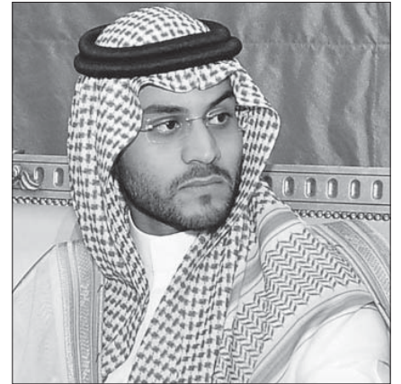
الأمير فيصل بن مقرن نائباً لأمر حائل، تعويضاً عن مقتل شقيقه منصور، نائب أمير عسير في حادث طائرة

إن دفعة التغييرات الأخيرة جاءت قبل أيام من جولة محمد بن سلمان الخارجية إلى بريطانيا والولايات المتحدة وفرنسا، حيث كانت الاستعدادات مبكرة للخروج في مظاهرات غاضبة لمنع دخوله إلى هذه الدول التي تشهد انتقادات متصاعدة لتورطها في تزويد النظام السعودي بالأسلحة الفتاكة. قد تحمل التغييرات في المؤسسة العسكرية إشارة إلى حالة إحباط لدى القيادة السياسية ومحاولة تحميل المسؤوليات للقيادة العسكرية الذين تم إعفاؤهم.. وقد تؤسس