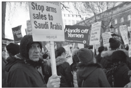
متظاهرون ضد بيع السلاح لآل سعود

هذه الاجواء انعكست عدم ارتياح لدى الامير محمد بن سلمان كما قالت مصادر صحافية بريطانية، على الرغم من الحفاوة التي اظهرها النسق الرسمي البريطاني. ورأت تلك المصادر ان اللعبة البريطانية لم تكن خافية حيث استفادت رئيسة الوزراء البريطانية من الاصوات المعارضة، وافسحت المجال للمعارضين للزيارة ليحتلوا مساحة واسعة في الشارع والاعلام، لكي تمنع في ابتزاز النظام السعودي، وتأخذ منه اقصى ما تستطيع من عقود تجارية والتزامات سياسية. كما ان الاجراء التي رافقت الزيارة انعكست على الاعلاميين السعوديين انفسهم الذي اسقط في ايديهم، وبدوا مربكين، ولا يستطيعون مواجهة الاعلام البريطاني، وهم يدركون كم الاسئلة المرحجة التي سواجهاونها، فيما يتعلق بالعدوان على اليمن، وايضاً ما يتعلق بالاجراءات القمعية التي يمارسها النظام في الداخل، وفتح ابواب السجون على مصراعها، واستمرار تنكره للحريات العامة وخصوصا حرية التعبير، ومعاداته الشديدة لكل مظاهر التمثيل الديمقراطي والمشاركة الشعبية في السلطة على اي مستوى.