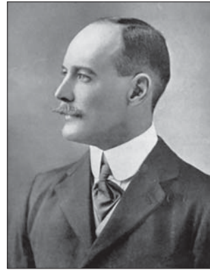
شكسبير، أول معتمد بريطاني في الرياض، قاتل مع ابن سعود وقتل في جراب ١٩١٥

لهذا، عينت المملكة المتحدة السير أنطوني سيلدون ليكون مبعوثاً خاصاً للتعليم لدعم رؤية ٢٠٣٠؛ كما أشادت المملكة المتحدة بأهمية الإدراج الناجح لشركة أرامكو السعودية بوصفها جزءاً من خطة السعودية للإصلاح الاقتصادي. وأكدت دعمها لصناعة الخدمات المالية السعودية، وأيدت السعودية بدورها مكانة لندن بوصفها مركزاً مالياً عالمياً رئيسياً، يتيح مدخلاً مميّزاً للمستثمرين والخبرات العالمية في الخدمات المالية والمهنية ذات العلاقة. واتفقت مجموعة لندن لأسواق الأوراق المالية، مع شركة تداول، على برنامج تدابير بناء القدرات والتدريب للمساعدة في تنمية أسواق الأوراق المالية.