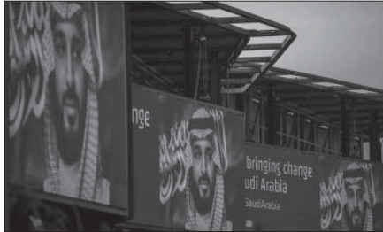
دعايات سعودية في لندن مدفوعة الثمن

وهذا ما جرى على الصعيد المعنوي والشكلي ليس الا.. اما على المستوى الدعائي والإعلامي، فالكل يعرف، وفي مقدمهم ولي العهد السعودي ومساعدوه، ان تلك الصور التي علقت على الجدران وفي الشوارع، وتلك الاعلانات الضوئية، هي من النشاطات الترويجية التي تقوم بها شركات متخصصة. وهي أنشطة مدفوعة الثمن سعودياً، ويمكن لأي متمول ان يقوم بها، وليس فيها اي معنى سياسي او اجتماعي.. ومن السذاجة ان يتحدث الصحافيون السعوديون عن هذه الظاهرة باعتبارها من علامات التكرم والعلاقات العميقة بين البلدين.