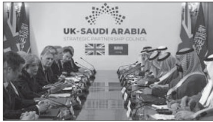
اجتماعات سعودية بريطانية: الثمن المطلوب دفعه ثمناً للعرش!

ان كل حديث عن الاعتدال لا يجري في اطار المفهوم السياسي للكلمة.. فكيف يكون اعتدالاً دون حق الانتخاب، واختيار السلطة السياسية، ومراقبة الانفاق والسيطرة على ثروة البلاد.. وكيف يكون اعتدالاً مع اجتثاث كامل للمعارضة بكل اشكالها وفتئاتها، من ناشطي حقوق الانسان الى الناشطين من اجل حقوق الاقليات ومنع التهميش والعزل الطائفي والمناطقى؟! ان هذا الاعتدال