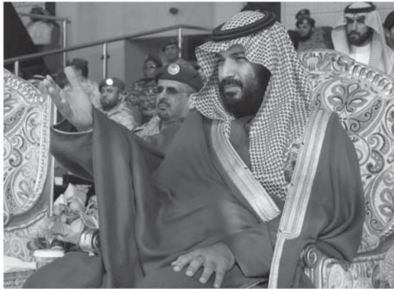
Saudi Arabia's Crown Prince Mohammed bin Salman