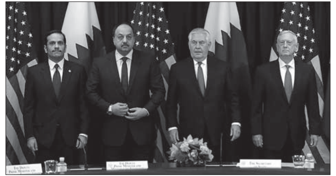
وزراء خارجية ودفاع أمريكا وقطر (يناير ٢٠١٨): هل سيستمر التعهد الأمريكي بحماية قطر بعد رحيل تيلرسون؟

■ في سوريا حيث يستعدّ الأمريكيون - فيما يبدو - لمواجهة سياسية قد تتطور الى عسكرية مع الروس والإيرانيين، وربما تتوسع لتشمل الكيان الصهيوني.