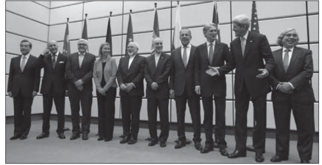
الإتفاق النووي الإيراني.. تفاؤل عمره عامان!

لكن السؤال الذي يواجه محمد بن سلمان ومضيفيه في واشنطن هو: ما هي الأولويات الأمريكية والسعودية؟ هل هو الصراع مع قطر، أم مع إيران؟