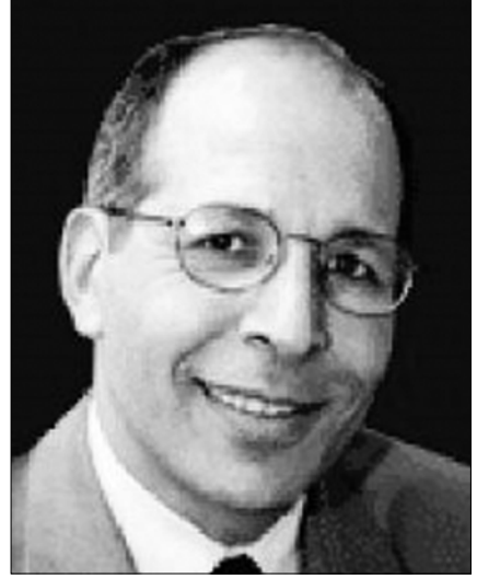
فندي: قلم للبيع!

الدولة العلمانية، فذاك يسهم في فهم الدولة ولكن شرط تغييرها يتطلب آلية أخرى بل ومنهجية أخرى، كالظلم، واحتكار السلطة والثروة، وتشجيع الفساد، والإستبداد، والتدخل الأجنبي، وهدر الكرامة الوطنية..