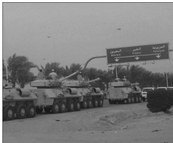
قوات سعودية لقمع المطلبين بالحرية في البحرين