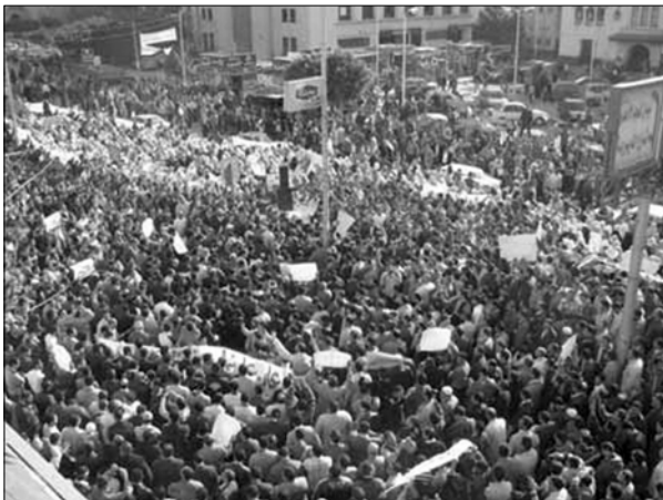
من مظاهرات المطالبة بالحرية في البحرين