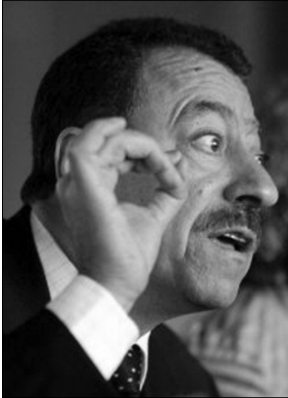
عبد الباري عطوان

القيادة السعودية لا تستطيع ان تنكر عدم معرفتها بمطالب الشعب السعودي، فقد تقدمت نخبهم الليبرالية والدينية بعرائض عدة تضمنت مطالبها كاملة، ابتداء من انتخاب مجلس شورى بصلاحيات رقابية وتشريعية كاملة، ومرورا بالتوزيع العادل للثروة، وانتهاء بمحاربة الفساد وتحويل البلاد الى ملكية دستورية.