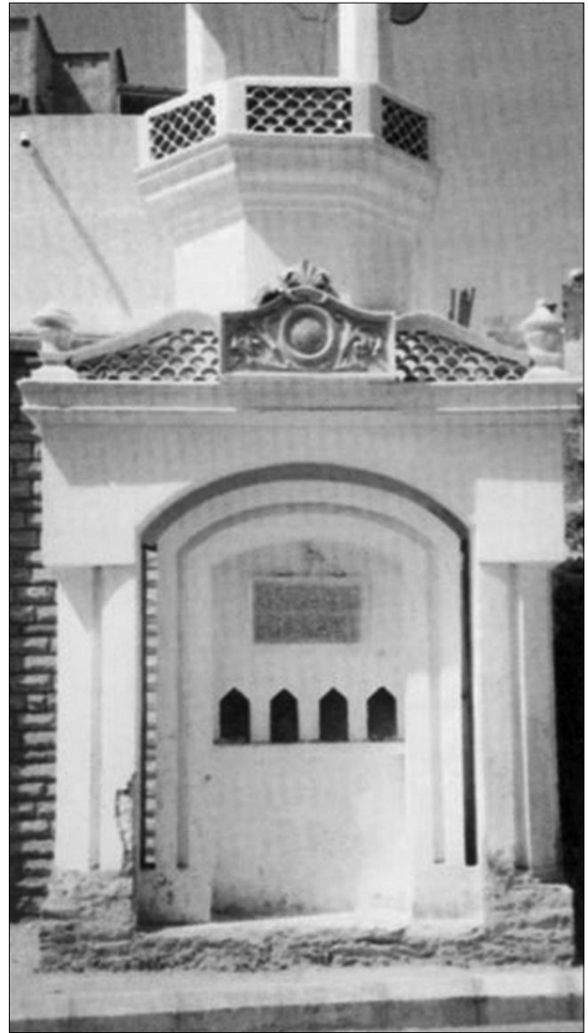
في العصر العثماني.

من خلال وثائق الوقف، يتضح أن أغلب الأقاليم التي اشتهرت بأوقاف حكام الدولة الإسلامية، على مر العصور، هي مصر والشام وتركيا والحجاز؛ بالإضافة إلى أوقاف دول أخرى في مناطق مختلفة من