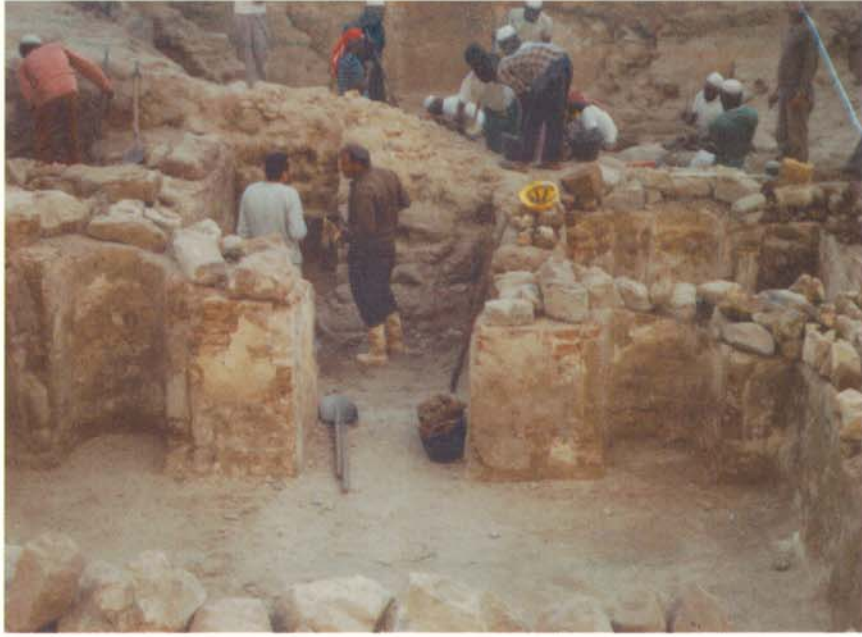
الحجرة التي كان يعيش فيها رسول الله صلى الله عليه وسلم مع أم المؤمنين خديجة رضي الله عنها