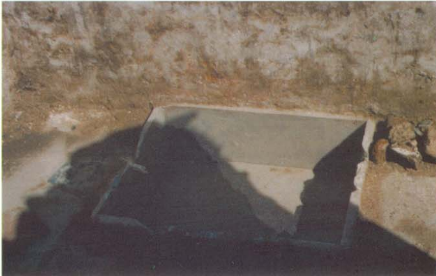
الحوض الذي وجد في حجرة التعبد وكان يوضع فيه الماء ليتوضأ منه رسول الله صلى الله عليه وسلم