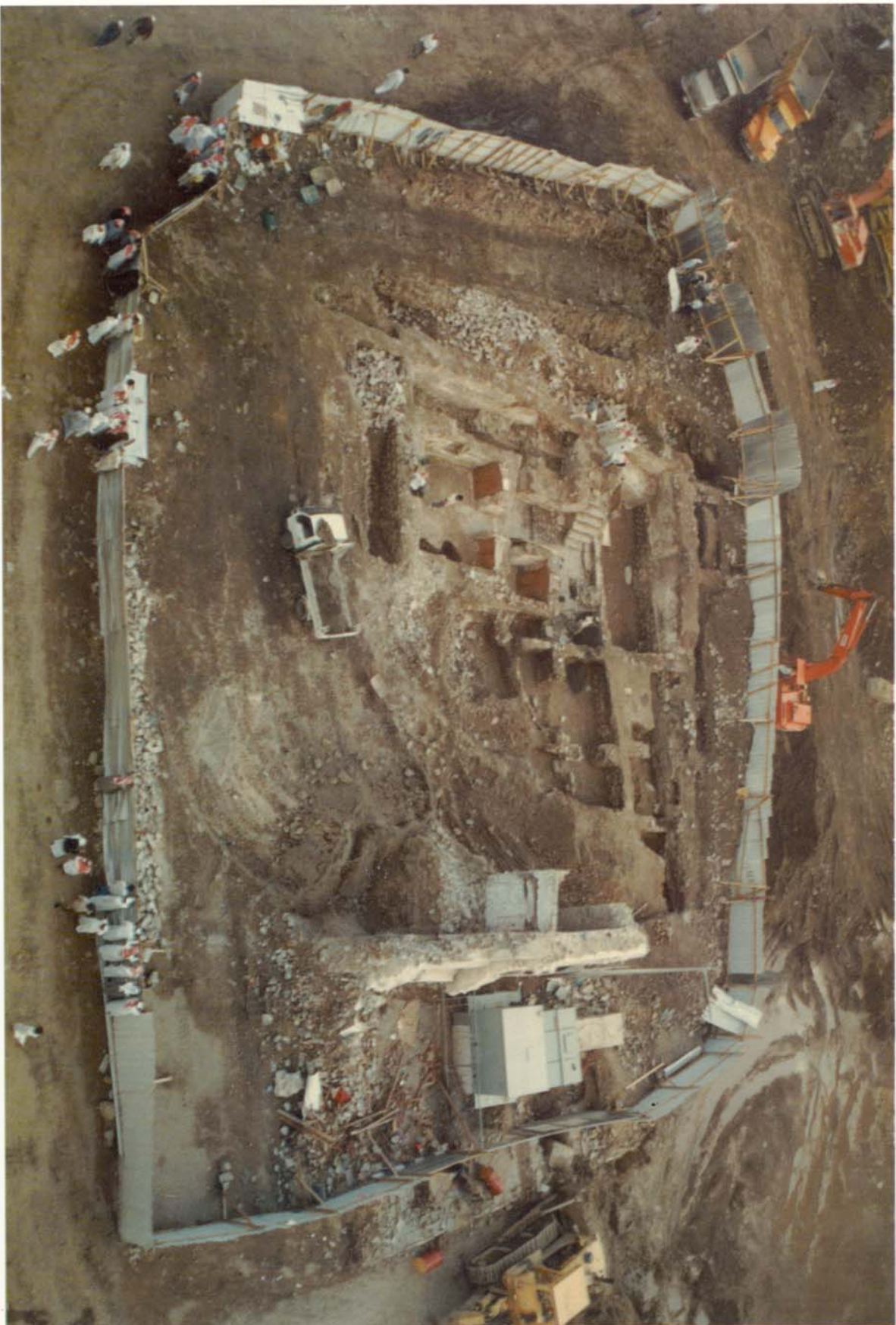
البيت الذي عاش فيه رسول الله صلى الله عليه وسلم ثمان وعشرين سنة