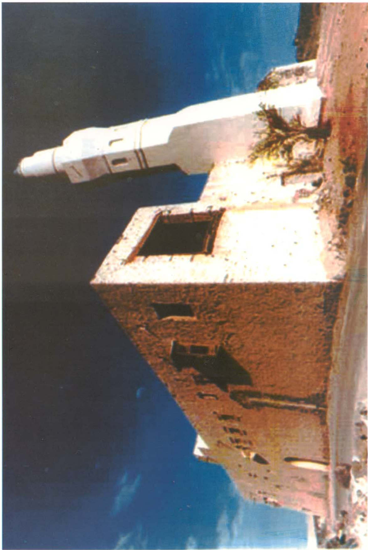
الجهة الشمالية والغربية لمسجد العريضي