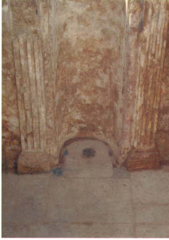
المحراب الذي كان موجوداً بالجدار الجنوبي الغربي بقبة الوحي